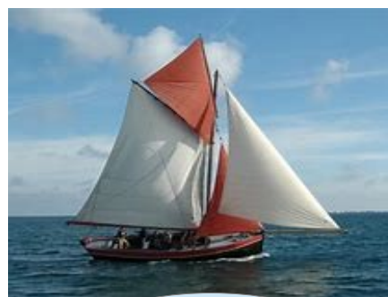
Enez Koalen (13 places)