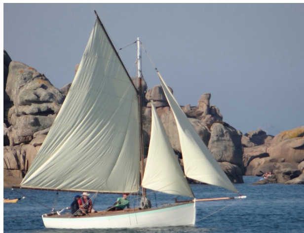
KOTICK dans les rochers de Ploumanac'h