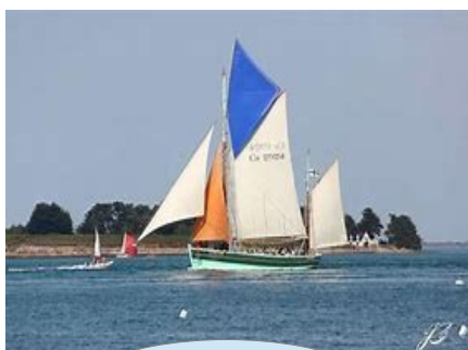
La Nébuleuse (38 places)

Nous pouvons vous mettre en contact avec des bateaux magnifiques tels que :