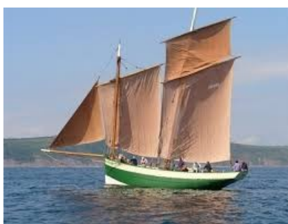
Le Grand Léjon