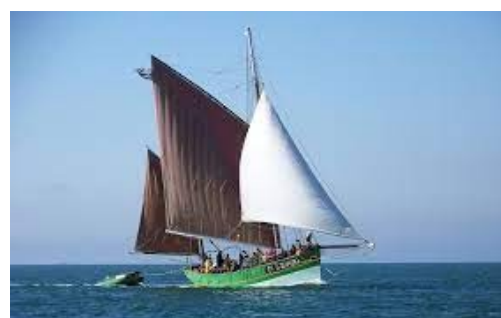
Sant C'hireg (23 places)

Rien de tel pour souder une équipe ou échanger dans un environnement naturel et simple. Revenir à l'essentiel !