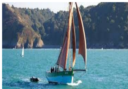
La Sainte Jeanne